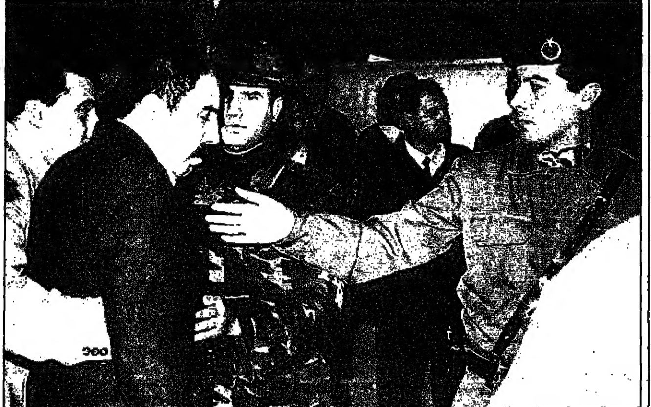
جنود الترك يساعدون احد الحكوميين بالاعدام على مغادرة قلعة الحكمة أمس

صنعاء - افيدت وزارة الداخلية اليمنية للجمعة ان سيارة مفخخة انفجرت امام مجمع حكومي في مدينة صنعاء (200 كلم شمال صنعاء) من دون ان تسفر عن وقوع ضحايا.